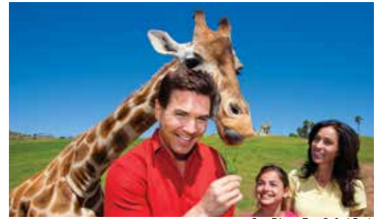
San Diego Zoo Safari Park